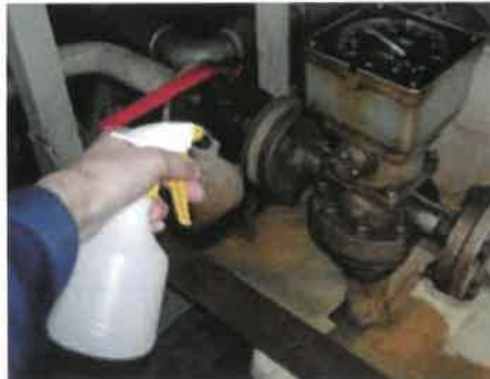
機械周りの油落としに