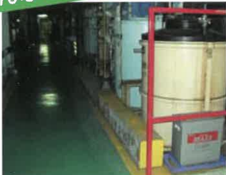
フローアの洗淨に

こんな場所に最適です。産業機械・工場・家庭などの油汚れ、シミ、クスマなどに驚異的な効果を発揮する洗淨液です。