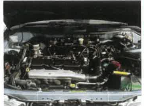
エンジンルームの洗淨に