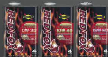
0W-30 10W-40 15W-50 荷姿：1L×10,20Lペール

※2ストロークエンジンオイルとしてはご使用いたしません。2ストロークバイクのミッションオイルとしてご使用いただけます。